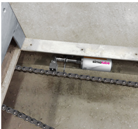
Vid behov kan simalube också monteras lutande.