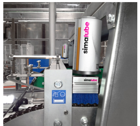
Två simalube med borste smörjer kedjan i ett bryggeri.