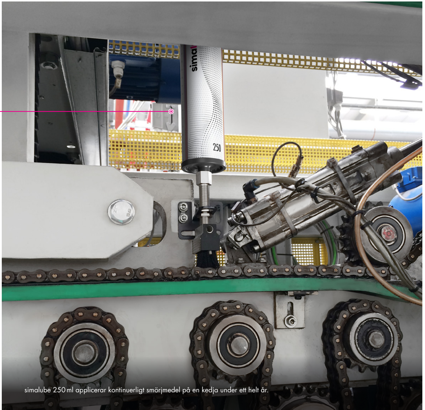
simalube 250 ml applicerar kontinuerligt smörjmedel på en kedja under ett helt år.