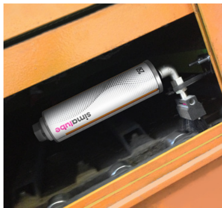
Transportörkedjan i en återvinningsfabrik smörjs och rengörs automatiskt med simalube och en borste.